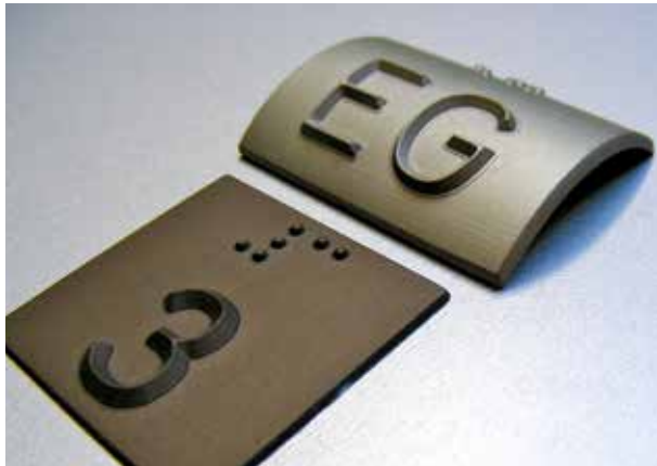
Produktbeispiel: Taktile Schilder (flach, gebogen) aus Aluminium

Einzelelemente aus Desmopan®, Edelstahl oder Messing werden sowie in- als auch outdoor eingesetzt und führen blinde und sehbehinderte Besucherinnen und Besucher an ihr Ziel. Zusätzlich sorgen Aufmerksamkeitsfelder (hier in der Geschäftsstelle des SC Paderborn 07 in Kombination mit Stufenprofilen) für mehr Sicherheit, indem Gefahrenstellen wie Aufzüge und Treppen abgesichert werden. Aufmerksamkeitsfelder warnen alle Mitarbeiter und Besucher frühzeitig und dienen so der Sturzprävention.