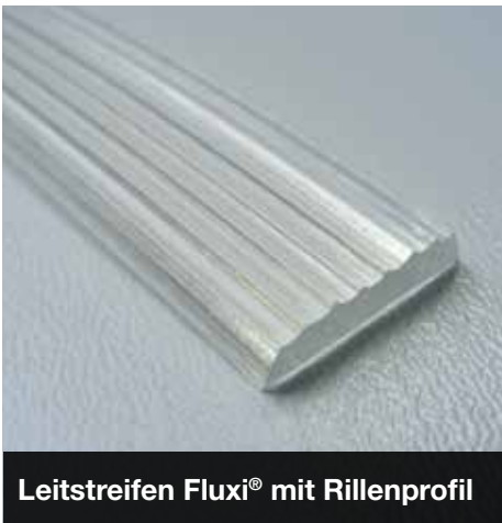
Leitstreifen Fluxi® mit Rillenprofil